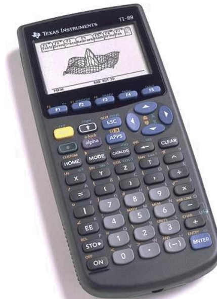
Data analysis and visualization